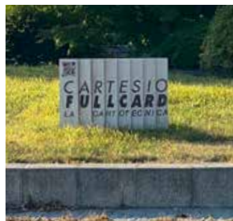
Insegne installate nella rotonda