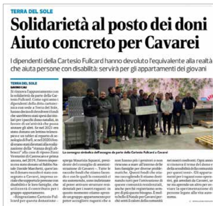
Donazione a favore di "CavaRei Società Cooperativa Sociale Impresa Sociale"