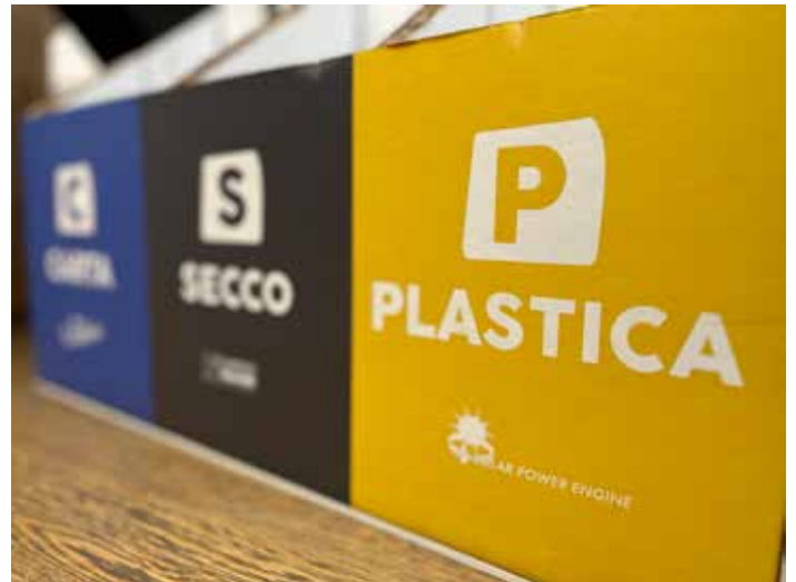
Bidoni per la raccolta differenziata