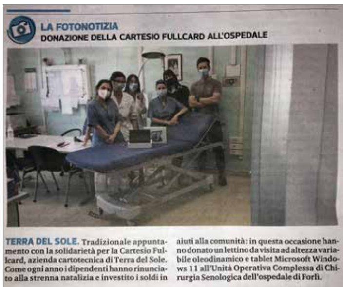
Donazione a favore dell'Unità Operativa Complessa di Chirurgia Senologica (Forlì)